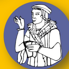
Juan Luis VIVÈS