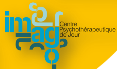
Centre Psychothérapeutique de Jour